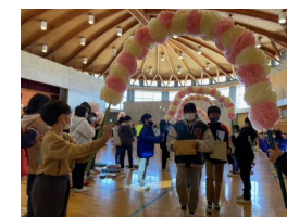
【アーチをくぐって退場】

3月3日（金）に、6年生を送る会を行いました。子どもたちにとって、6年生を送る会は特別な会です。なぜなら、6年生に直接、感謝の気持ちを伝えられる絶好の機会であるばかりか、数時間かけて練習した出し物や色紙などを通して、感謝の真心を伝えられる機会だからです。卒業式は、なかなかそのようにはいきません。来年度、本校を牽引する5年生が中心となり、今回も感動的な「会」となりました。1年生は可愛い踊りを披露しながら、最後はプラカードを使って感謝の気持ちを伝えました。2年生は、6年生に「応援」を行い、可愛いチアリーダーも登場しました。3年生は、6年生の活躍を振り返るパフォーマンスと合奏を披露。4年生は合奏と、力強い呼びかけを行いました。そして5年生は、「来年度は、私達に任せてください」と言わんばかりの雨傘を使ってのパフォーマンスと、素晴らしい合奏を披露しました。1年間活動を共にした縦割り班のメンバーで撮った写真が貼られた色紙に、全員のコメントが寄せられ、6年生にプレゼントされました。アーチをくぐって退場する6年生の顔は、どれも満面の笑み。全ての子どもたちの真心と努力が詰まった、感動的な6年生を送る会となりました。