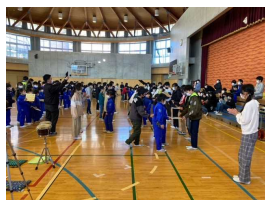
【6年生ハプリーズント】