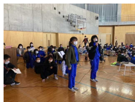
【5年生による6年生の紹介】