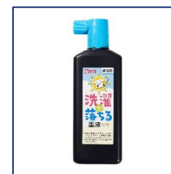
洗濯で落ちる墨汁